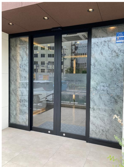
プレサンス京橋スタイルギャラリーエントランス