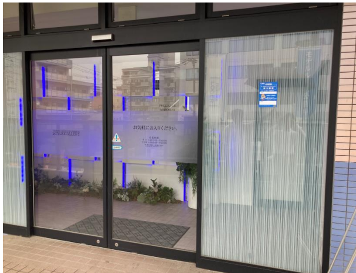
プレサンス御堂筋「東三国」スタイルギャラリーエントランス

〔営業時間〕〔平日〕AM11:00～PM8:00〔土・日・祝〕AM10:00～PM8:00（定休日：火曜日・水曜日）定休日が祝日の場合、翌木曜日が振替定休となります。