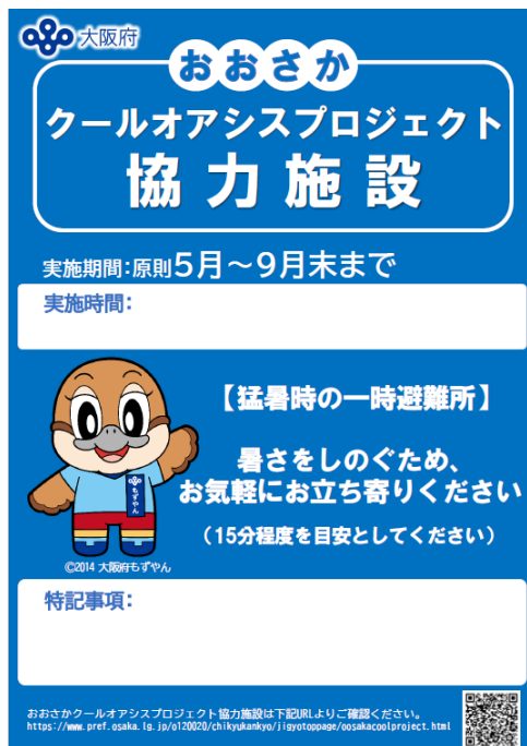
おおさかクールオアシスプロジェクト協力標識

〔営業時間〕〔平日〕AM11:00～PM8:00〔土・日・祝〕AM10:00～PM8:00（定休日：火曜日・水曜日）定休日が祝日の場合、翌木曜日が振替定休となります。