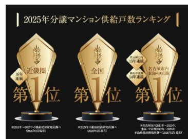
2025年新築分譲マンション供給戸数が全国で1位を獲得。 (2026年2月時点)