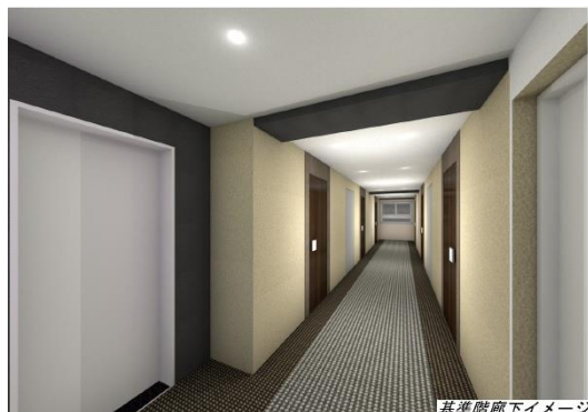
基準階廊下イメージ